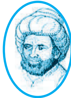
मुहम्मद इब्न मूसा अल-ख्वारिज़्मी (780 – 850 सा.यु.)

प्रमेयिका एक सिद्ध किया हुआ कथन होता है और इसे एक अन्य कथन को सिद्ध करने में प्रयोग करते हैं।