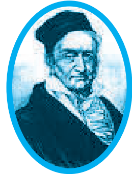
कार्ल फ्रैड्रिक गॉस (1777 – 1855)

अंकगणित की आधारभूत प्रमेय के रूप में विख्यात होने से पहले, प्रमेय 1.2 का संभवतया सर्वप्रथम वर्णन यूक्लिड के एलीमेंट्स की पुस्तक IX में साध्य (proposition) 14 के रूप में हुआ था। परंतु इसकी सबसे पहले सही उपपत्ति कार्ल फ्रैड्रिक गॉस (Carl Friedrich Gauss) ने अपनी कृति डिसक्विशंस अरिथमेटिकी (Disquisitiones Arithmeticae) में दी। कार्ल फ्रैड्रिक गॉस को प्रायः 'गणितज्ञों का राजकुमार' कहा जाता है तथा उनका नाम सभी समयकालों के तीन महानतम गणितज्ञों में लिया जाता है, जिनमें आर्किमिडीज़ (Archimedes) और न्यूटन (Newton) भी सम्मिलित हैं। उनका गणित और विज्ञान दोनों में मौलिक योगदान है।