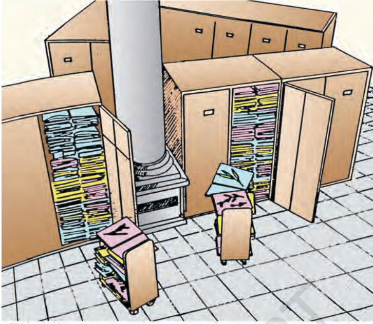
चित्र 1.2 वनस्पति संग्रहालय में पौधों के एकत्रित नमूने