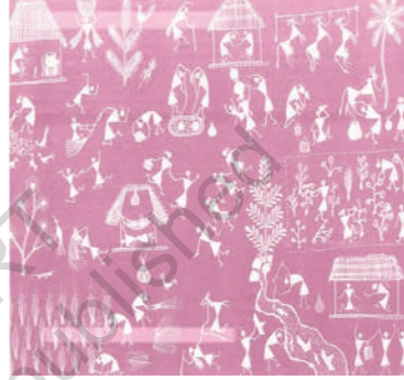
महाराष्ट्र की वरली शैली में बने चित्र

चौथी से छठी सदी के बीच गुप्त साम्राज्य कलाओं के लिए स्वर्ण युग कहलाता है। अजंता की गुफ़ाएँ उन्हीं दिनों खोदी गयीं। उनकी दीवारों पर चित्र बनाए गए। बाग और बादामी की गुफ़ाएँ भी