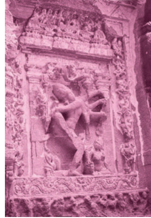
एलोरा की गुफ़ाओं में कैलाश मंदिर का चित्र