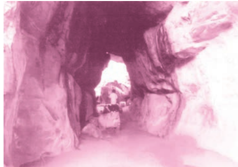
भीमबेटका की गुफा के चित्र