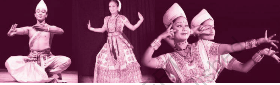
असम का सत्रिय नृत्य

मैसूर में डोडवा कबीले के लोग बालाकल नृत्य करते हैं। इसमें रंगीन वेशभूषा के साथ-साथ हाथ में तलवारें होती हैं। केरल के कुरुवांजी नृत्य को भरतनाट्यम का प्रेरणा स्रोत माना जाता है। गुजरात का टिप्पणी नृत्य भी समूह के साथ होता है। यह फसल की कटाई के बाद खलिहान में किया जाता है।