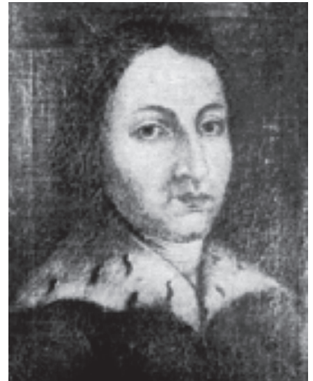
कोपरनिकस का आत्म-चित्र।

खगोलीय का अर्थ दैवी या स्वर्गीय है जबकि पार्थिव में दुनियावी गुण अंतर्निहित है।