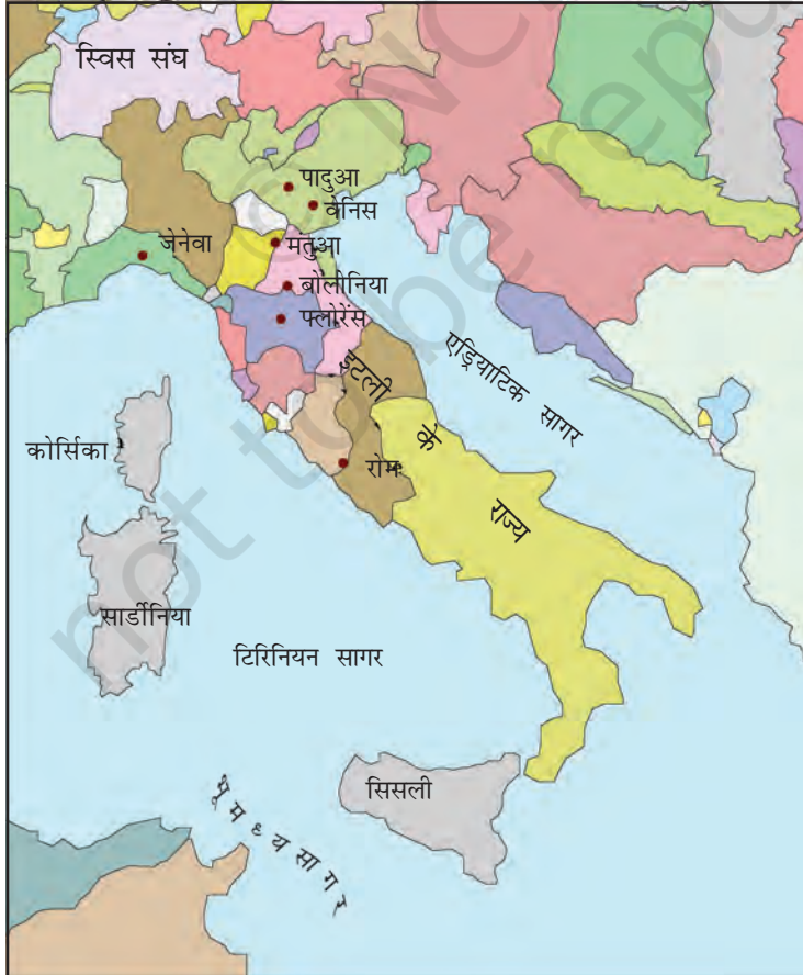
मानचित्र 1 : इटली के राज्य।

बाइज़ेंटाइन साम्राज्य और इस्लामी देशों के बीच व्यापार के बढ़ने से इटली के तटवर्ती बंदरगाह पुनर्जीवित हो गए। बारहवीं शताब्दी से जब मंगोलों ने चीन के साथ 'रेशम-मार्ग' (देखिए विषय 5) से व्यापार आरंभ किया तो इसके कारण पश्चिमी यूरोपीय देशों के व्यापार को बढ़ावा मिला। इसमें इटली के नगरों ने मुख्य भूमिका निभाई। अब वे अपने को एक शक्तिशाली साम्राज्य के अंग