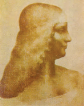
इसाबेला दि इस्ते।

फेदेले की रचनाओं से यह बात सामने आती है कि इस काल में सब लोग शिक्षा को बहुत महत्त्व देते थे। वे वेनिस की अनेक लेखिकाओं में से एक थीं जिन्होंने गणतंत्र की आलोचना “स्वतंत्रता की एक बहुत सीमित परिभाषा निर्धारित करने के लिए की, जो महिलाओं की अपेक्षा पुरुषों की इच्छा का ज्यादा समर्थन करती थी।” इस काल की एक अन्य प्रतिभाशाली महिला मंटुआ की मार्चिसा ईसाबेला दि इस्ते (Isabella d' Este, 1474-1539) थीं। उन्होंने अपने पति की अनुपस्थिति में अपने राज्य पर शासन किया। यद्यपि मंटुआ, एक छोटा राज्य था तथापि उसका राजदरबार अपनी बौद्धिक प्रतिभा के लिए प्रसिद्ध था। महिलाओं की रचनाओं से उनके इस दृढ़ विश्वास का पता चलता है कि उन्हें पुरुष-प्रधान समाज में अपनी पहचान बनाने के लिए अधिक आर्थिक स्वायत्तता, संपत्ति और शिक्षा मिलनी चाहिए।