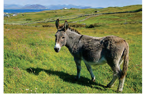
चित्र 9.2 खच्चर

यद्यपि कृत्रिम वीर्यसेचन की क्रिया को अपनाया जाता है फिर भी बहुधा परिपक्व नर तथा मादा पशुओं के मध्य होने वाले संगम से, उत्पन्न संकरण की दर से मिलने वाली सफलता कुछ कम ही होती है। संकरों के सफल उत्पादन में सुधार लाने के लिए अन्य विधियों का भी प्रयोग किया जाता है। मल्टीपिल औवियूलेशन, एम्ब्रियो ट्रांसफर (भ्रूण अंतरण) तकनीक गौ पशुओं में सुधार का एक कार्यक्रम है। इस विधि में, एक गाय में पुटक परिपक्वन तथा उच्च अंडोत्सर्जन को प्रेरित करने के लिए जब एफएसएच प्रकार का हॉर्मोन दिया जाता है। सामान्यतः प्रतिचक्र में एक अंडे की तुलना में 6-8 अंडे उत्पन्न होते हैं। पशु को या तो सर्वोत्कृष्ट साँड़ (बैल) अथवा कृत्रिम वीर्यसेचन द्वारा संगमनित कराया जाता है। 8-32 कोशिका अवस्थाओं वाले निषेचित अंडे को बिना शल्य चिकित्सा से प्राप्त कर प्रतिनियुक्त मादा (माँ) में स्थानांतरित कर दिया जाता है आनुवंशिक मादा (माँ) उच्च अंडोत्सर्जन के दूसरी पारी के लिए उपलब्ध हो जाती है। यह प्रौद्योगिकी गौपशु, भेड़, खरगोश, भैंस, घोड़ी आदि में प्रदर्शित की जा चुकी है। उच्च दुग्ध उत्पादन वाली नस्ल की मादाओं तथा उच्च गुणवत्ता वाले माँस (कम वसा वाला माँस) प्रदान करने वाली नस्लों के बैलों को सफलतापूर्वक जनित किया गया है, जिससे अल्प काल में ही बड़ी संख्या में गौपशु प्राप्त हुए हैं।