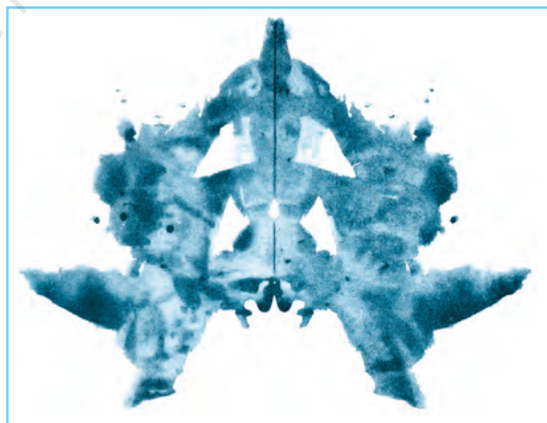
चित्र 2.4 रोशा मसिलक्ष्म का एक उदाहरण

हैं, दो कुछ लाल स्याही के साथ हैं और बाकी तीन पेस्टल रंगों के हैं। धब्बे एक विशिष्ट आकृति या आकार के साथ सममितीय रूप में दिए गए हैं। प्रत्येक धब्बा 7"×10" के आकार के एक सफेद कार्ड बोर्ड के केंद्र में मुद्रित (छपा हुआ) है। ये धब्बे मूलतः एक कागज के पन्ने पर स्याही गिरा-कर फिर उसे आधे पर से मोड़कर बनाए गए थे (इसलिए इन्हें मसिलक्ष्म परीक्षण कहा जाता है)। इन कार्डों को व्यक्तिगत रूप से प्रयोज्यों को दो चरणों में दिखाया जाता है। पहले चरण को निष्पादन मुख्य अथवा उपयुक्त (performance proper) कहते हैं जिसमें प्रयोज्यों को कार्ड दिखाए जाते हैं और उनसे पूछा जाता है कि प्रत्येक कार्ड में वे क्या देख रहे हैं। दूसरे चरण को पूछताछ (inquiry) कहा जाता है जिसमें प्रयोज्य से यह पूछकर कि कहाँ, कैसे और किस आधार पर कोई विशिष्ट अनुक्रिया उनके द्वारा की गई है, इस आधार पर उनकी अनुक्रियाओं का एक विस्तृत विवरण तैयार किया जाता है। प्रयोज्य की अनुक्रियाओं को एक सार्थक संदर्भ में रखने के लिए बिल्कुल ठीक या सटीक निर्णय आवश्यक है। इस परीक्षण के उपयोग और व्याख्या के लिए विस्तृत प्रशिक्षण आवश्यक होती है। प्रदत्तों की व्याख्या के लिए कंप्यूटर तकनीकों को भी विकसित किया गया है। रोशा मसिलक्ष्म का एक उदाहरण चित्र 2.4 में दिया गया है।