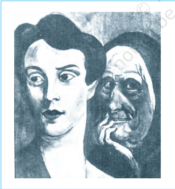
चित्र 2.5 टी.ए.टी. के एक कार्ड के चित्र का उदाहरण