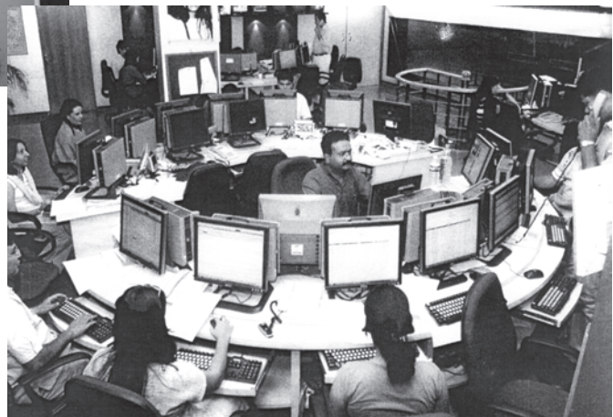
21वीं सदी का दूरदर्शन समाचार कक्ष, भारत

औद्योगिक क्रांति के साथ ही, मुद्रण उद्योग का भी विकास हुआ। कुलीन मुद्रणालय के प्रथम उत्पाद साक्षर अभिजात लोगों तक ही सीमित थे। तत्पश्चात् 19वीं सदी के मध्य भाग में आकर जब प्रौद्योगिकियों, परिवहन और साक्षरता में और आगे विकास हुआ, तभी समाचारपत्र जन-जन तक पहुँचने लगे। देश के विभिन्न क्षेत्रों में रहने वाले लोगों को एक जैसे समाचार पढ़ने या सुनने को मिलने लगे। ऐसा कहा जाता है कि इसी के फलस्वरूप देश के विभिन्न भागों में रहने वाले लोग परस्पर जुड़े हुए महसूस करने लगे और उनमें 'हम की भावना' विकसित