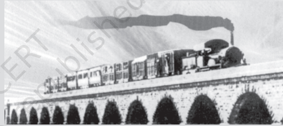
भारत में पहले क्रीक पुल जो कि थाणे के पास है। उसके ऊपर से गुजरती हुई रेलगाड़ी-1854

1861 और 1878 के बीच, 269 वर्ग मील का विस्तृत जंगल आरक्षित घोषित कर दिया गया। सन् 1894 तक यह क्षेत्र 3683 वर्गमील का हो गया। और यह बढ़ते-बढ़ते 19वीं सदी के अंत तक 20061 वर्ग मील का हो गया, (जिसमें कुल प्रांत का 42.2 प्रतिशत क्षेत्रफल था) इसमें से 3,609 वर्ग मील को आरक्षित रखा गया था। इसमें गौर करने की बात यह है कि जंगल का वो बड़ा क्षेत्र जिसमें आदिवासी समुदायों का निवास था और जो सदियों से वहाँ जीवनयापन करते आए थे, भी प्रशासकीय नियंत्रण में आ गया। पहाड़ी क्षेत्रों में आदिवासी जनजातीय समुदाय जंगलों से संबद्ध होकर प्रकृति के साथ मैत्रीपूर्ण जीवन जीते थे।