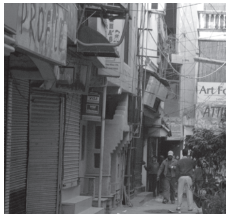
एक नगरीय गाँव का दृश्य

आजादी के बाद के दो दशकों में भारत में नगरीकरण की प्रक्रिया का प्रभाव स्पष्ट रूप से दिखने लगा था। नगरीकरण अनेक प्रकारों से हो रहा था। इस पर विचार व्यक्त करते हुए समाजशास्त्री एम. एस. ए. राव ने लिखा है कि भारत के कई गाँव भी तेजी से बढ़ रहे नगरीय प्रभाव में आ रहे थे। नगरीय प्रकृति का प्रभाव गाँवों का शहर या नगर से कैसा संबंध है पर निर्भर करता है। उन्होंने तीन भिन्न प्रकार के नगरीय प्रभावों की स्थिति की व्याख्या की है।