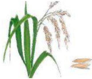
चित्र संख्या 7.1 धान

वर्षा ऋतु में जो फसलें उगायी जाती है। उनमें किस फसल को अधिक पानी की आवश्यकता होती है? धान की फसल को अधिक पानी की आवश्यकता होती है। धान खरीफ की प्रमुख फसल है। धान की उन्नत खेती के लिए निम्नलिखित बातों का जानना आवश्यक है।-