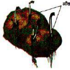
चित्र 11.6 आलू की आँख से अंकुरित होता पादप

एक आलू लेकर दो या तीन टुकड़े में काट लें। ध्यान रहे उनकी पर्व संधि (आँखें) क्षतिग्रस्त न हों। अब इन टुकड़ों को मिट्टी में दबा दें और नियमित पानी डालते रहे। 8-10 दिनों के बाद मिट्टी हटाकर उन टुकड़ों को निकालें और प्रेक्षण करें। इनमें आए परिवर्तन के बारे में शिक्षक एवं अपने साथियों से कक्षा में चर्चा करें।