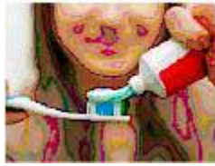
चित्र 17.3 (अ)

चित्र 17.3 (अ) एवं (ब) को देखकर विचार कीजिए कि टूथपेस्ट की ट्यूब को दबाने पर टूथपेस्ट बाहर क्यों निकलता है तथा चुम्बक के निकट अलग-अलग स्थान पर चुम्बकीय सुई को रखने पर इसमें विक्षेप क्यों होता है ?