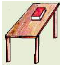
चित्र 17.4 (ब)

पुस्तक मेज पर थोड़ी दूर जाकर रुक जाती है (चित्र 17.4 (ब))। आप जानते हैं कि किसी गतिशील वस्तु को रोकने के लिए गति के विपरीत दिशा में बल लगाने की आवश्यकता होती है। क्या पुस्तक को रोकने में किसी बल का प्रयोग हुआ ?