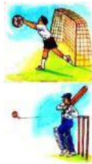
चित्र 17.1 (ब)