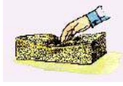
(चित्र 17.2) आकृति परिवर्तन