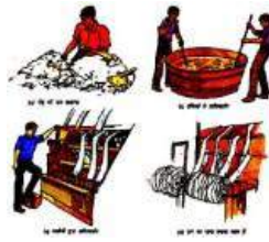
चित्र 2.2 भेड़ के रेशे को ऊन में संसाधित करने के विभिन्न चरण

अभिमार्जन से प्राप्त रेशों को सुखा लिया जाता है। इस प्रकार प्राप्त छोटे-छोटे कोमल व फूले हुए रेशों की ऊन के धागों के रूप में कताई की जाती है।