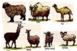
चित्र 2.1 ऊन प्रदान करने वाले जन्तु

जिन वास स्थानों पर बालों से ढके जो जन्तु पाए जाते हैं वहाँ उन्हीं जन्तुओं के रेशों से ऊन प्राप्त किया जाता है। उदाहरणतः जम्मू कश्मीर के पहाड़ी क्षेत्रों में पायी जाने वाली अंगोरा बकरी से अंगोरा ऊन तथा कश्मीरी बकरी से पश्मीना ऊन की शालें बनायी जाती हैं। याक का ऊन तिब्बत और लद्दाख में प्रचलित है। दक्षिण अमेरिका में लामा और ऐल्पेका नामक जन्तुओं से ऊन प्राप्त किया जाता है। (चित्र 2.1)