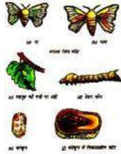
चित्र 2.3 (अ) रेशम कीट के जीवन चक्र के विभिन्न चरण

लार्वा प्यूपा में रूपान्तरित हो जाते हैं। रेशम के रेशों से लिपटे हुए प्रत्येक प्यूपा एक सफेद गोलाकार संरचना में बन्द हो जाते हैं। इन प्यूपायुक्त गोलाकार रचनाओं को कोया या कोकून कहते हैं। कोकून के भीतर ही प्यूपा विकसित होकर वयस्क रेशम कीट में बदल जाता है। अन्त में रेशम कीट कोकून के रेशों को काटते हुए बाहर निकल आते हैं तथा अपना नया जीवन चक्र प्रारम्भ करते हैं। (चित्र 2.3)