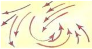
चित्र 3.4 चक्रवात की रचना

चक्रवाती तूफान विभिन्न आकार के होते हैं। इनकी गति 130 किमी प्रति घंटे से भी अधिक होती है। चक्रवात समुद्र में तेज चलते हैं। स्थल पर इनकी गति कम हो जाती है। चक्रवाती तूफान कई दिनों तक प्रभावी रहता है। इसमें वायु की गति इतनी तीव्र होती है कि जीवन को अस्त-व्यस्त कर देती है।