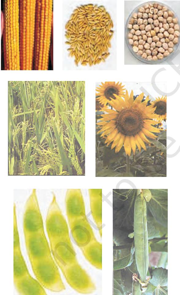
चित्र 15.1: विभिन्न प्रकार की फसलें

ऊर्जा की आवश्यकता के लिए अनाज; जैसे-गेहूँ, चावल, मक्का, बाजरा तथा ज्वार से कार्बोहाइड्रेट प्राप्त होता है। दालें जैसे चना, मटर, उड़द, मूँग, अरहर, मसूर से प्रोटीन प्राप्त होती है और तेल वाले बीजों; जैसे-सोयाबीन, मूँगफली, तिल, अरंड, सरसों, अलसी तथा सूरजमुखी से हमें आवश्यक वसा प्राप्त होती है (चित्र 15.1)। सब्जियाँ, मसाले तथा फलों से हमें विटामिन तथा खनिज लवण, कुछ मात्रा में प्रोटीन, वसा तथा कार्बोहाइड्रेट भी प्राप्त होते हैं। चारा फसलें; जैसे-वर्सीम, जई अथवा सूडान घास का उत्पादन पशुधन के चारे के रूप में किया जाता है।